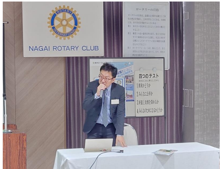
職業奉仕委員会 小笠原委員長より卓話