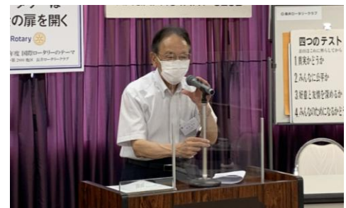
一年間ありがとうございました。