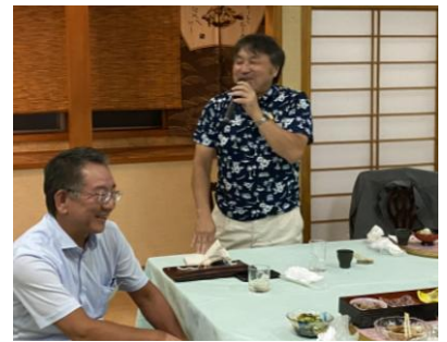
いろいろな想いが話され国際交流も最高潮に。発表者の皆さんありがとうございました。