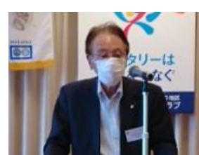
会報委員会 横澤委員長