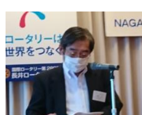
プログラム委員会 大道寺委員