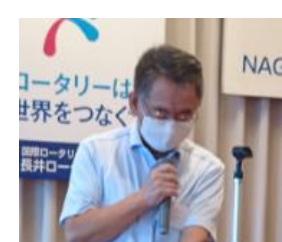
ニコニコ BOX 寒河江委員