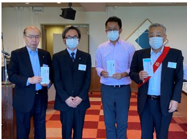
(在籍年数表彰会員)