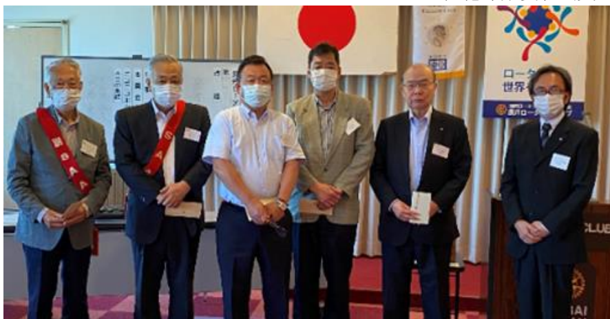
(誕生日記念表彰会員)