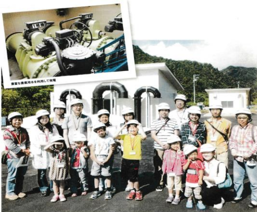
「長井市」第1号の野川小水力発電所を長井市（山形県長井市）にて