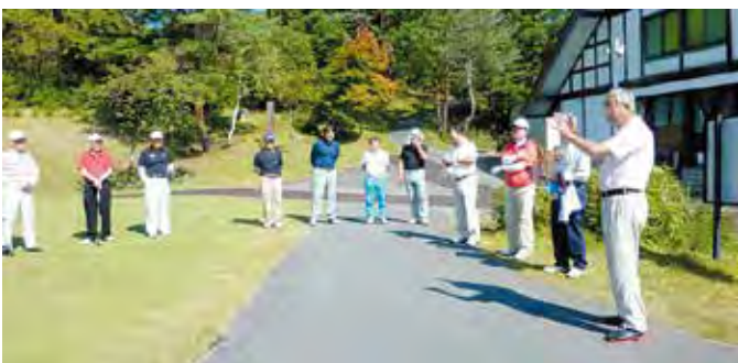
表彰式(タスパークホテル)